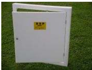
Dvířka do skříní HUP cena dle rozměrů