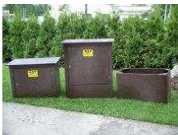
Skříně HUP cena dle rozměrů